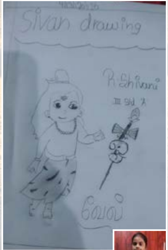
இரா.ஷிவானி அரசு நகராட்சி நடுநிலைப் பள்ளி கோவில் பதாகை