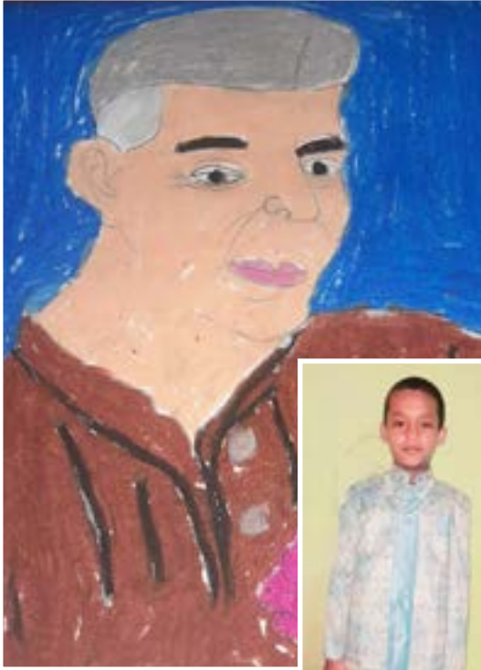
ஜீ.தேஜேஷ் அரசு நகராட்சி நடுநிலைப் பள்ளி கோவில் பதாகை