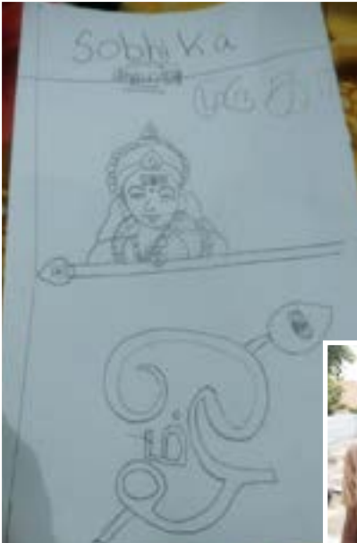
இரா.சோபிகா அரசு நகராட்சி நடுநிலைப் பள்ளி கோவில் பதாகை