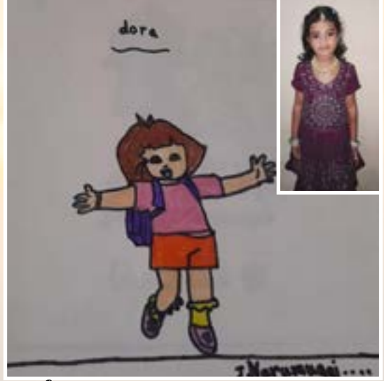
ஜீ.நறுமுகை அரசு நகராட்சி நடுநிலைப் பள்ளி கோவில் பதாகை