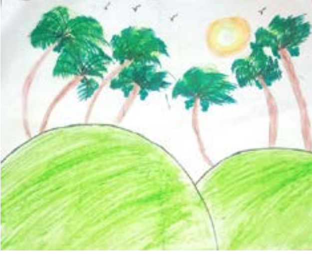
↖ ஸ்ரீ. ருணல் ரேயான் நான்காம் வகுப்பு.