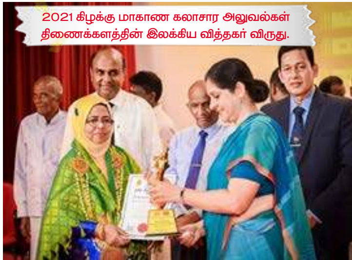
2021 கிழக்கு மாகாண கலாசார அலுவல்கள் திணைக்களத்தின் இலக்கிய வித்தகர் விருது.