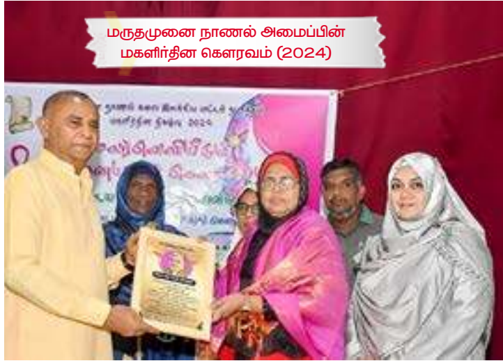
மருதமுனை நாணல் அமைப்பின் மகளிர்தின கௌரவம் (2024)