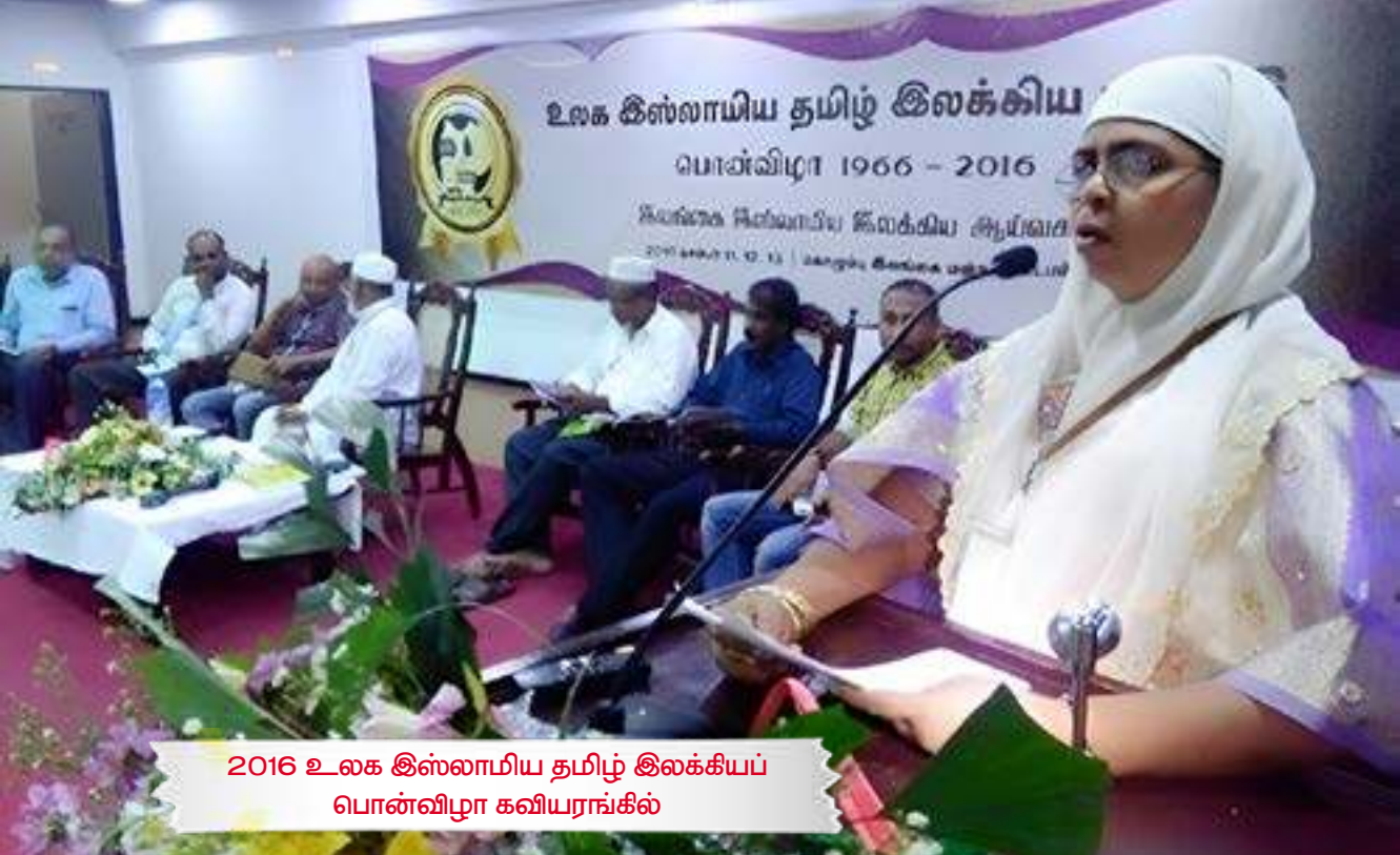
2016 உலக இஸ்லாமிய தமிழ் இலக்கியப் பொன்விழா கவியரங்கில்

சர்வதேச ரீதியில் கொண்டுபோகும் இலட்சியம் உள்ளதுதான். ஆயினும் அதில் அவசரப்படுவதாக இல்லை. உள் வீட்டில் பசியோடிருப்பனுக்கு வயிறார உணவிட்டு பசி தீர்ந்தபின்தானே அடுத்த தெருவைப்பற்றி சிந்திக்க முடியும். எங்கள் அமைப்பின் பெண்கள் தங்களது ஆற்றல்களை மேம்படுத்திக் கொள்ள