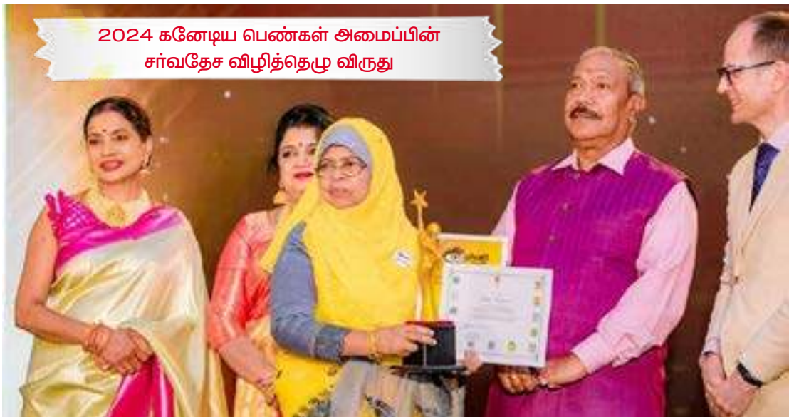
2024 கனேடிய பெண்கள் அமைப்பின் சர்வதேச விழித்தெழு விருது

வியாபார நோக்கத்தில் நூல்கள் வெளியிடும் முகநூல் குழுமங்களிடம் ஏமாறாதீர்கள் (சில சிறந்த அமைப்புகளும் உண்டுதான்.) நீங்கள் செலுத்தும் அதே கட்டணத்திற்கு நம் நாட்டிலேயே அதைவிட இருமடங்கு நூல்களை நீங்கள் பெறலாம். தவிர அவர்கள் ISBN முத்திரை தருவதில்லை. ISBN முத்திரையற்ற நூல்கள் உங்களுக்கு எந்த அங்கீகாரத்தையும் தராது.