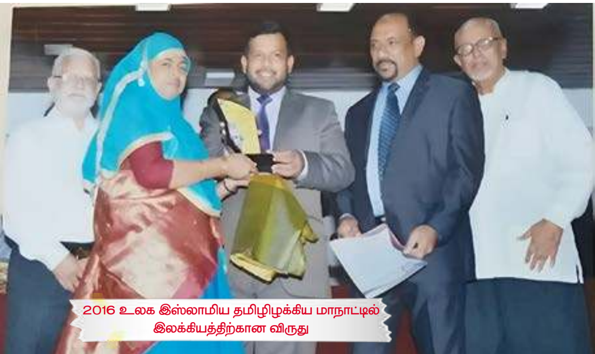
2016 உலக இஸ்லாமிய தமிழிழக்கிய மாநாட்டில் இலக்கியத்திற்கான விருது

நம்நாட்டின் அச்சுப் பத்திரிகைகளுக்கும் சஞ்சிகைகளுக்கும் அவசியம் எழுதுங்கள். அப்போதுதான் நீங்களும் ஒரு இலக்கியவாதியாக இனங்கண்டு கொள்ளப்படுவீர்கள்.