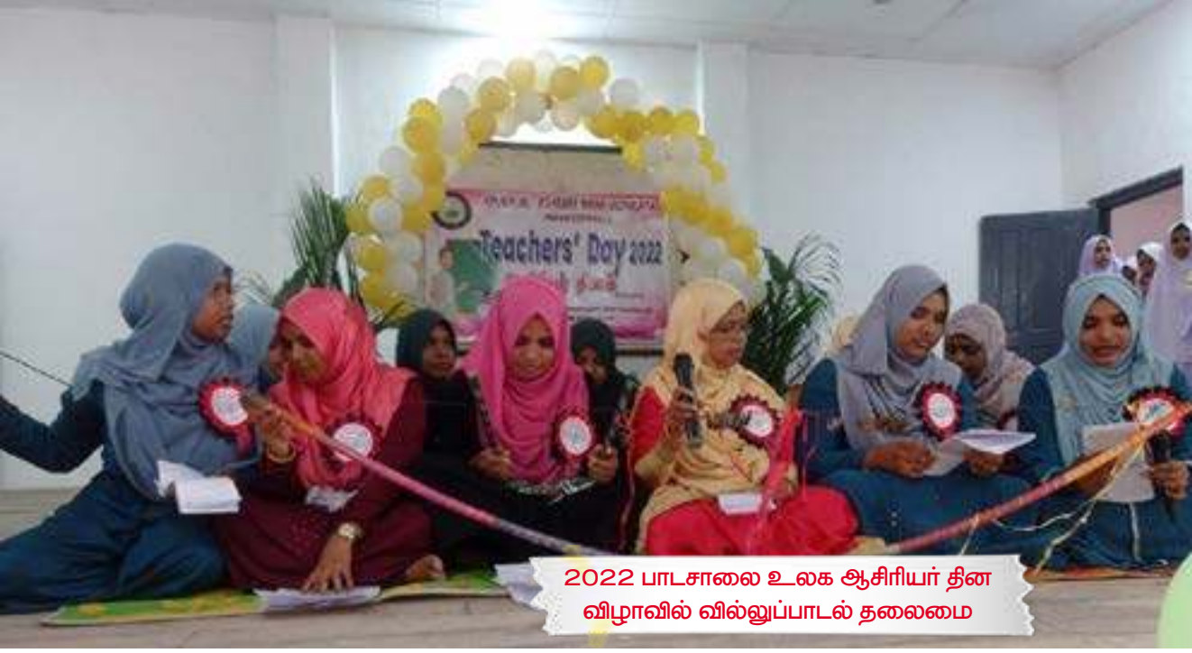
2022 பாடசாலை உலக ஆசிரியர் தின விழாவில் வில்லுப்பாடல் தலைமை

ஆயினும் செயற்திட்டங்கள் வேறு பட்டாலும் தேசிய ரீதியில் அனைத்து பிரதேசங்களும் ஒரே திட்டமிடலில்தான் இடம்பெறும். இவ்விடயம் பற்றி எமது அமைப்பு புதிய வருடத்தில் பிரச்சினைகளை இனங்கண்டு தீர்வுபெற எண்ணியிருக்கிறது.