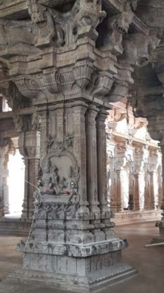
சிற்ப நுட்பத்துடன் கூடிய கல்தூண்கள்

அறிய முடியும். இதன் மூலம் சங்க கால மக்கள் தாவரங்கள் மற்றும் விலங்குகள் அஹ்ரிணையே ஆயினும், அதன் மீது அளவு கடந்த அன்பினைக் கொண்டிருந்தனர் என்பதனை நம்மால் உணர முடியும். அவ்வழியே ஐந்தறிவு மற்றும் ஆறறிவு கொண்ட உயிரினங்களான விலங்குகள் மற்றும் மனிதர்களுக்கு அடிப்படை ஆதாரமான மற்றும் முதன்மை உணவாவதும்