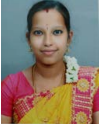
ஆண்டாள் ரங்கநாயகி கோயம்புத்தூர்