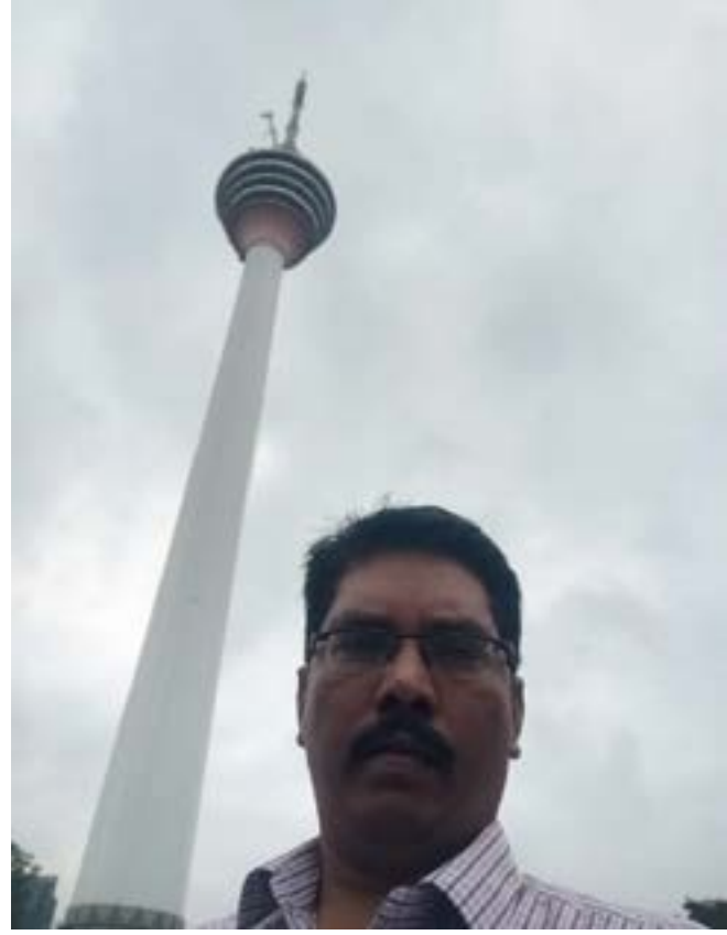
KL டவரின் முன்பாக

மலேசியாவின் இரட்டை கோபுரத்தை போலவே கே எல் டவர் என்று அழைக்கப்படுகின்ற ஒரு முக்கியமான