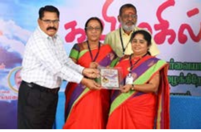
கவிமுகில் விருது பெற்றபோது

வேறு தலைப்பு கொடுங்கள். இப்போது அரசியல் வட்டாரத்தில் இதை ஒத்த கருத்து பெரும் பிரச்சினைய கிளப்பி உள்ளது.