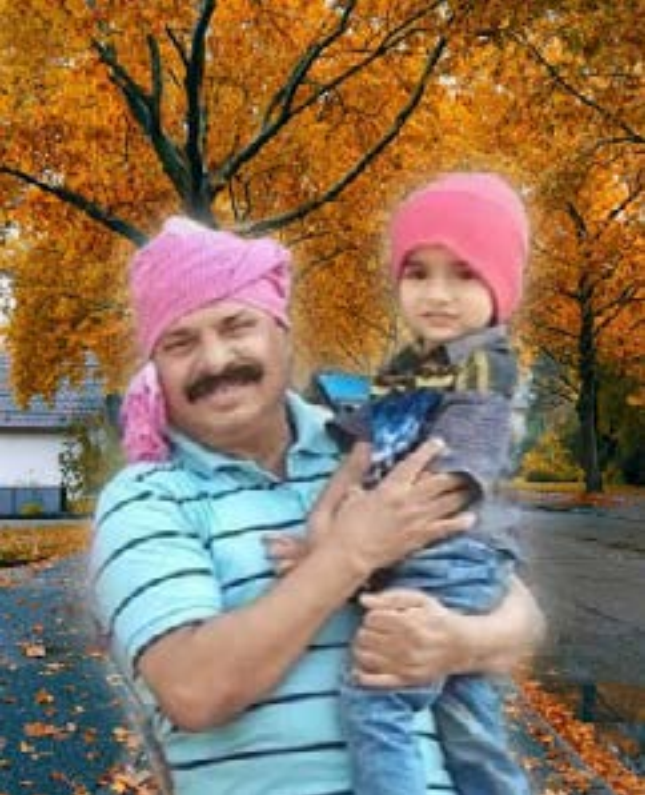
பெயரனுடன் கவிஞர் சையத் யாகூப்