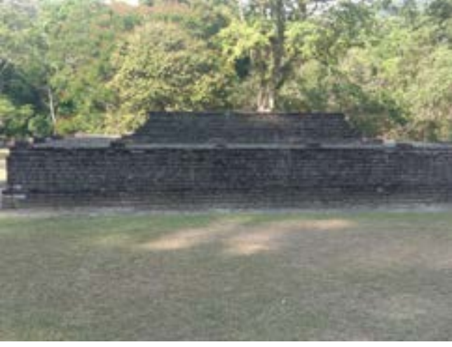
கடாரம் கொண்டான் கோவில்

கொள்ளிப் பாக்கை : இஃது ஐதரா பாத்துக்கு நாற்பத்தைந்து கல் வடகிழக்கே உள்ளது. இதன் இன்றைய பெயர் 'கூல்பாக்' என்பது. இது 'கொள்ளிப் பாக்கை ஏழாயிரம்' எனப்படும். இந்நாடு 13-ஆம் நூற்றாண்டுவரை சிறப்புற்றிருந்தது. இதன் மதில் சுள்ளிமரங்கள் நிறைந்தது. இஃது ஆறாம் விக்ரமதித்தனின் காலத்தில் அவனுடைய மகனான மூன்றாம் சோமேசுவரனால் ஆளப்பட்டு வந்தது.