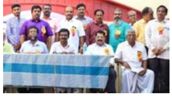
கவியரங்கத்தில் மற்ற கவிஞர்களுடன்

பிழை இல்லாது எழுதப் பழக வேண்டும். நாம் எழுதும் நான்கு எழுத்துக்கள் நான்கு பேருக்காவது பின்னாளில் பயன்படப் போகிறது. ஆகையால் சிறிதேனும் தமிழை வளர்க்கும் எண்ணத்தோடு எழுதப் பட வேண்டும். வெறும் எதுகை மோனை இயைபு மட்டும் இருந்தால் போதும் என்று உரைநடையாகவோ அல்லது கன்னாபின்னாவென எழுதாமல் கட்டுக்கோப்போடு எழுத வேண்டும்.