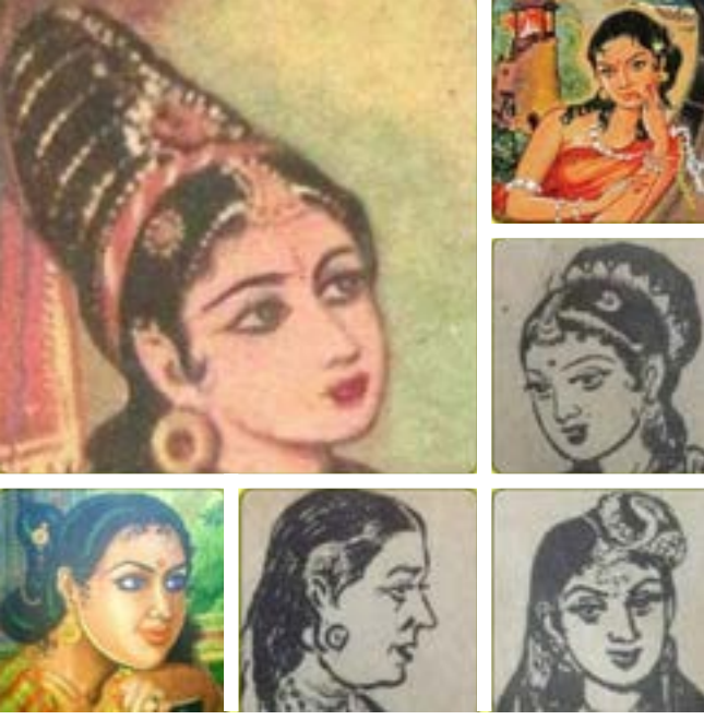
பொன்னியின் செல்வனில் வரும் கதாபாத்திரங்களில் சில

பொன்னியின் செல்வனில் வரும் 37 கதாபாத்திரங்களுக்கும் தனித்தனியே முக பாவனை, சிகை அலங்காரம், நகை, நடை, உடை, உடல்மொழி என வேறுபடுத்திக் காட்டி உயிரோவியங்களாகப் புதினத்தின் வழியே உலவ விட்டிருப்பது இன்றளவும் நம்மிடையே பிரமிக்க வைக்கிறது. அதிலும்