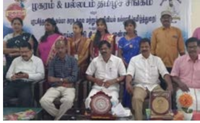
பல்லடத்தில் நடந்த கவியரங்கில் மற்ற கவிஞர்களுடன்

◆ நீங்கள் எழுதும் கவிதைகளில் ஏராளமான புழக்கத்தில் இல்லாத சொற்களைப் பயன்படுத்துவது ஏன்?