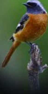
அஸீஸ் எம் பாயிஸ்