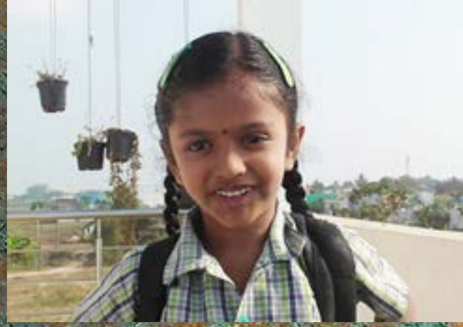
எழிலி (எ) ச.ஞா.எழிலரசி 1ஆம் வகுப்பு தமிழ் வழி ஊராட்சி ஒன்றிய தொடக்கப் பள்ளி, கடம்பத்தூர், திருவள்ளூர் மாவட்டம்