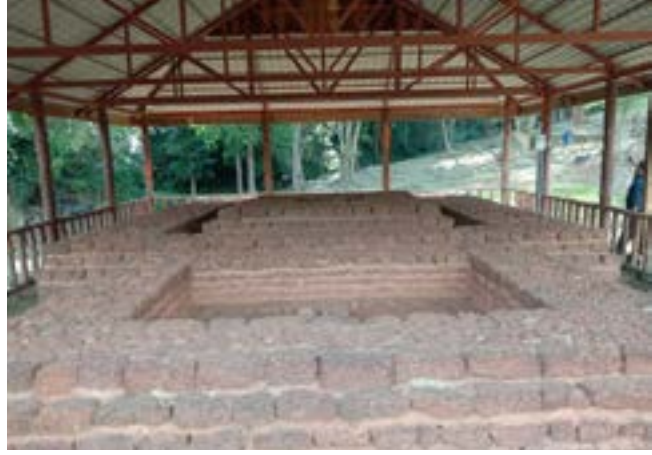
கடாரம் கொண்டான் யாகசாலை

இந்தப் பகுதியின்றான் மதுரமண்டலம் (ஓரிஸ்ஸாவில் உள்ள 'மதுபன்' என்பது), நாமனைக்கோலம், பஞ்சப் பள்ளி ஆகிய இடங்களும் இருந்திருத்தல் வேண்டும். (ஆதிநகரில் இந்திராதனை வென்று கோசல நாட்டையும் காடுகள் செறிந்த ஓட்டரதேசத்தையும் கைக் கொண்டான். திருவாலங்காட்டுச் செப்பேடுகள், இராசேந்திரன் ஓட்டர தேசத்து அரசனைக்கொண்டு, அவன் தம்பியிடம் பன்மணிக்குவியலைத் திறை கொண்டான் என்று குறிக்கின்றன. பிறகு, இவன், தன்மபாலனது தண்டபுத்தி இரணசூரன் ஆண்ட தென்லாடம்,