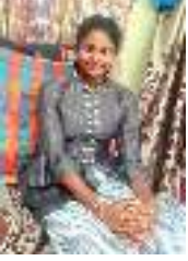
தா.உ.ஜான்வீ பத்தாம் வகுப்பு, பூம்புகார்.

சங்கம் அமைத்து சான்றோர்களால் வளர்ந்தவளே! சிற்றிலக்கிய வகைகள் பெருகி சீராய் மேம்பட்டவளே! சுவடிகளில் நின் பெருமை கூரிய ஒளியாய் மிளர்கிறது! செந்நாபோதர் திருக்குறளின் கீர்த்தி சேர்கிறது அயல்நாட்டவருக்கு! சைகை மொழியிலும் சொல் பொருள் மாறாமல் சோர்வின்றி புதுமை அடைந்துள்ளாய் சௌந்தர்யமாக!!!