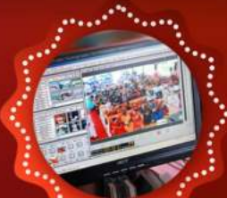
SPOT MIXING & YOU TUBE LIVE