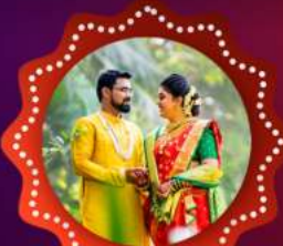
OUT DOOR PHOTOGRAPHY