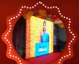
WALL LED DISPLAY