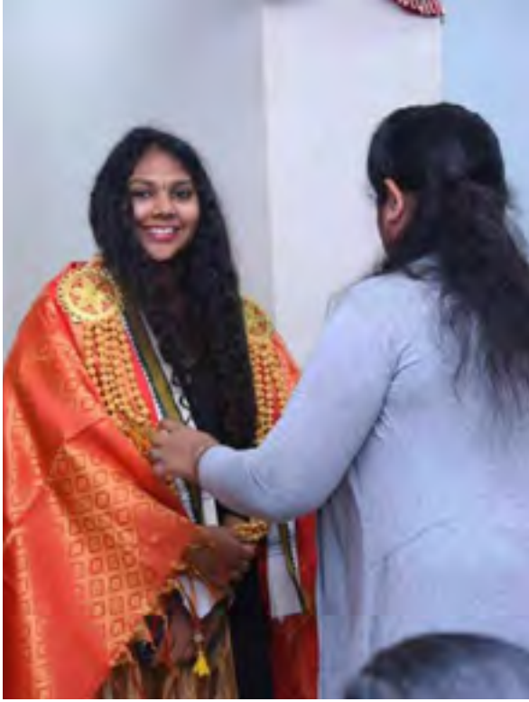
விழாவொன்றில் கிடைத்த அங்கீகாரம்.

இது ஒரு பெரிய குடும்பம். எங்களுக்கும், எழுத்தாளர்களுக்குமான உறவு புத்தகம் வெளிவந்தவுடன் முடிவடைவதில்லை. எப்போதும் தொடர்ந்து கொண்டிருப்பதையே விரும்புகிறோம்.