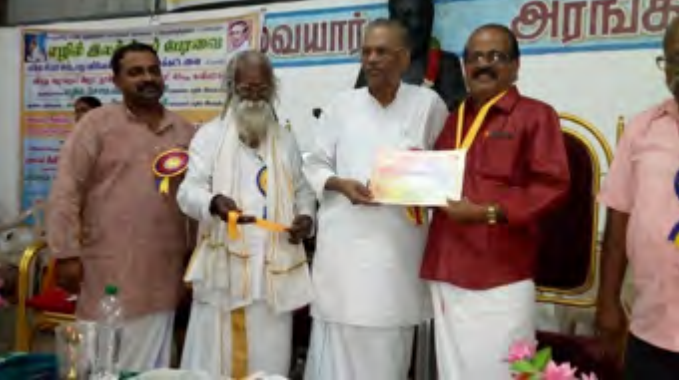
புரட்சிக்குயில் பொன்னடியான் அவர்கள் விருது வழங்கிப் பாராட்டுகிறார்