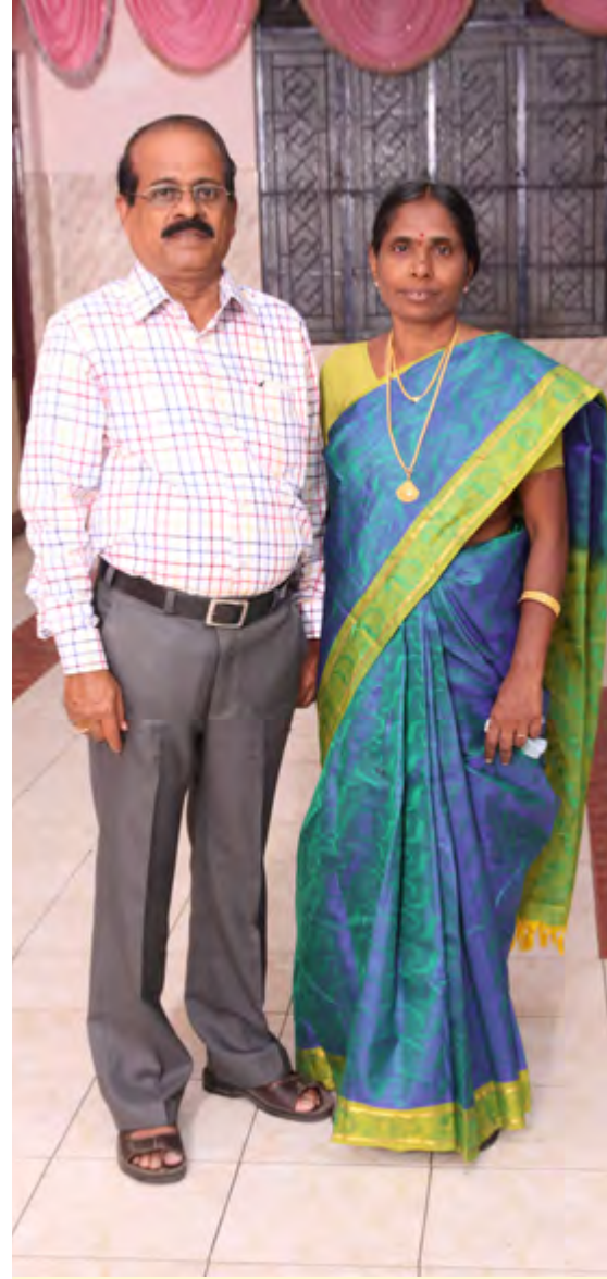
கவிக்கோ தன் துணைவியாருடன்

இது இருபத்தாறு அடிகளாலான பஃறொடை / கலிவெண்பா. இருபத்தாறடிகளும் ஓரெதுகை / இனவெதுகையே பயின்றுவரும். நான் சொல்கிற இக்கருத்து நானறிந்தவரை மட்டுமேயன்றி வேறல்ல.