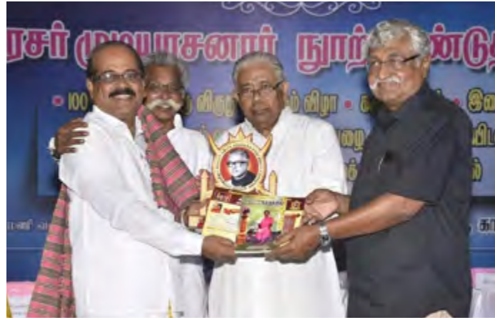
சுப.வீ அவர்களுடன் கவிக்கோ