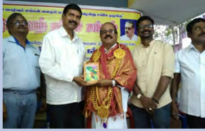
கண்ணதாசன் கலைஇலக்கிய மன்றத்தின் பாரிட்டு மழையில் கவிக்கோ

தாங்கள் மரபுக்கவிஞர். ஆனாலும் புதுக் கவிதை,நவீனம், ஹைக்கூ என எல்லாமும் எழுதுகிறீர்கள். எதை எழுதும்போது ஆத்மார்த்தம் உணருகிறீர்கள். ஏன்?