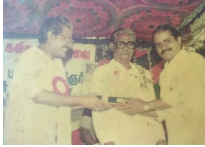
பாவேந்தர் விருது வழங்குபவர்: தமிழ்க்குடிமகன் உடன்: மன்னர்மன்னன்

வருகைதரும் பங்கேற்பாளர்களுள் சிலரும் தாமாக முன்வந்து செலவுகளை ஏற்றுக்கொள்கின்றனர். அதனால் உதவி