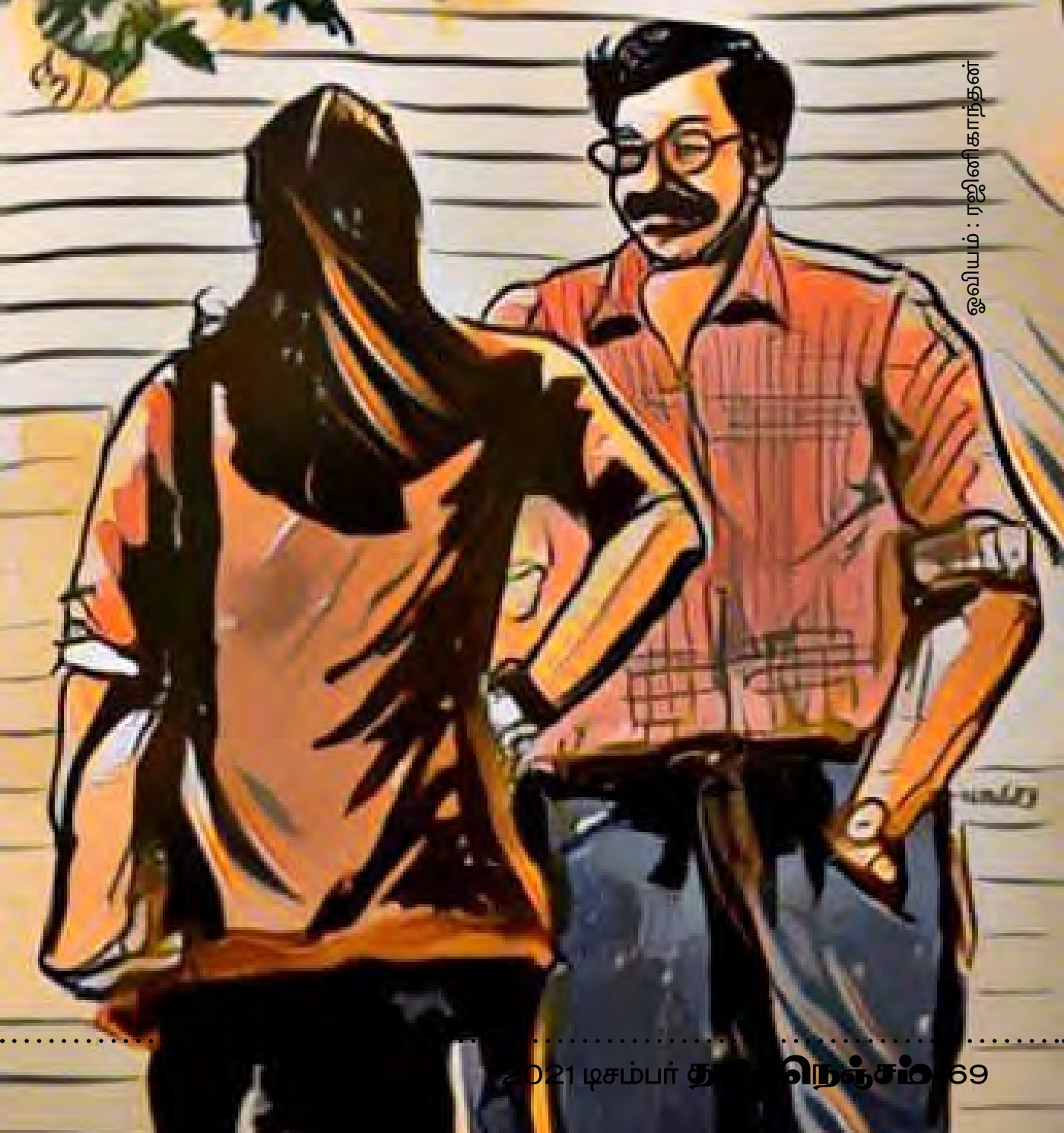
ஓவியம் : ரஜினிகாந்தன்

“அனு என்ன செய்யறா?” என்று பார்வதி கேட்டார்.