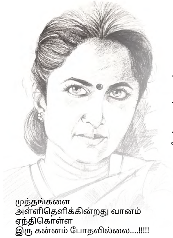
ஓவியம் : அருண் குமார்

முத்தங்களை அள்ளிதெளிக்கின்றது வானம் ஏந்திகொள்ள இரு கன்னம் போதவில்லை.....!!!!